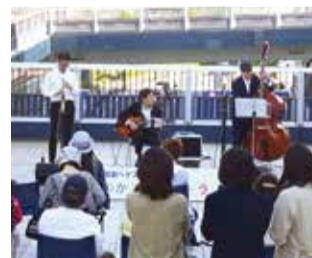
とつかストリートライブの様子