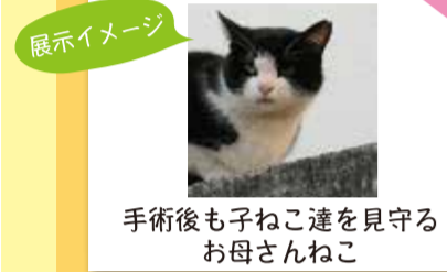
手術後も子ねこ達を見守るお母さんねこ

7月22日(月)～31日(水) 8時45分～17時(土日は9時から) 区役所3階区民広間