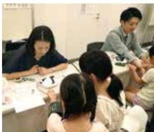
湘南医療大学の看護師体験