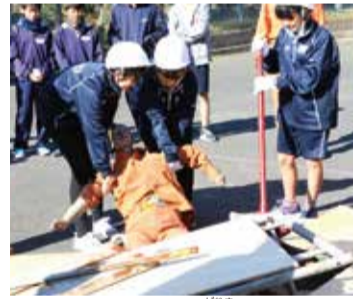
油圧ジャッキを使用した瓦礫からの救出訓練