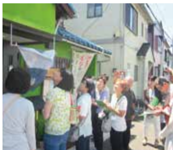
「地域づくり大学校」現場訪問の様子