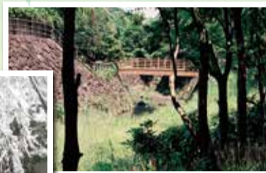
川岸まで降りることができます