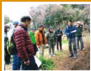
消防団や地域のこども会など、さまざまな団体がこの森を守るために活動しています。週1回の清掃やパトロールをはじめ、草刈りや間伐も行っています。