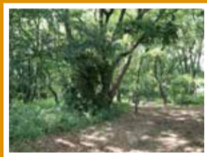
草を刈って園路が暗くならないようにしています。