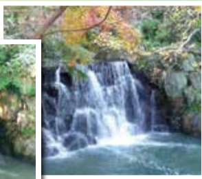
季節によっていろいろな表情を見せてくれる滝