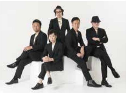
ゲスト:チキンガーリックステーキ

♥とつかアカペラコンテスト観覧者募集!! 観覧者のあなたも審査に加われます! 第一部:予選通過10組による音楽バトル 第二部:チキンガーリックステーキによる コンサート ※日本初アカペラグループの素敵なハー モニーをお楽しみください。 第三部:結果発表・表彰式 ㊟3月8日(日)14時(13時30分開場) ㊟戸塚公会堂 講堂 ㊟1,000円(自由席) 【チケット】1月11日から戸塚公会堂、戸塚 地区センター、チケットぴあ他 ※未就学児の入場不可 ※詳細問合せ