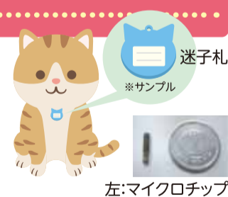
左:マイクロチップ

災害時にはペットと離ればなれになることもあります。迷子になったときすぐに見つかるように、鑑札(犬の場合)や迷子札を首輪などに着けておきましょう。マイクロチップの装着と飼い主情報の登録をおすすめします。