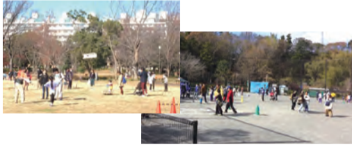
▲地域でのスポーツイベント

【申込方法】事前相談の上、申請書類一式を直接区役所事業企画担当(6階61番窓口)へ。詳細は応募要項(区役所6階61番窓口、フレンズ戸塚、区内地域ケアプラザで配布か、区役所HPからダウンロード)をご覧ください。