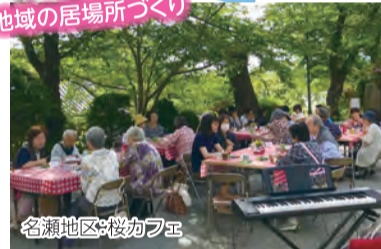
名瀬地区:桜カフェ