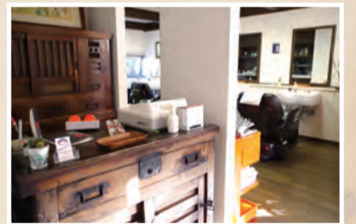
▲昔からの家具を今も大切に使っています