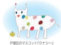
戸塚区のマスコット「ウナシー」