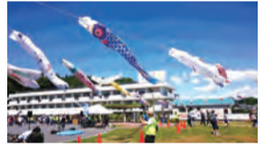
▲地域でのイベント風景

【申込方法】申請書類一式を直接区役所地域活動係(9階94番窓口)へ。詳細は、申込期間中に配布する募集要項(区役所3階情報コーナー、9階94番窓口、とつか区民活動センター、区内地区センターで配布か、区役所HPからダウンロード)をご覧ください。