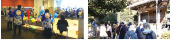
▲とつかの文化芸術祭 ▲戸塚区歴史探訪ウォーキング

【申込方法】詳細は応募要項(区役所3階情報コーナー・9階94番窓口・とつか区民活動センターなどで配布か、区役所HPからダウンロード)をご覧ください。