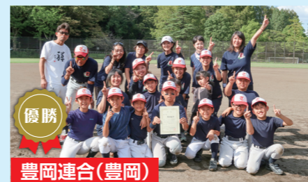
優勝 豊岡連合(豊岡)