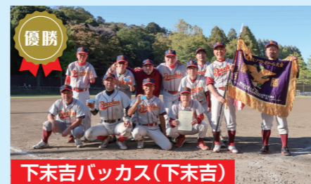
優勝 下末吉バックス(下末吉)