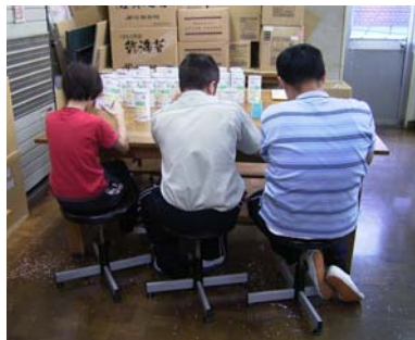
↑作業の様子 *円形のペットボトルに紙を張り付ける作業が難しかったそうです。