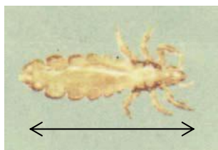
成虫 (約 3mm)