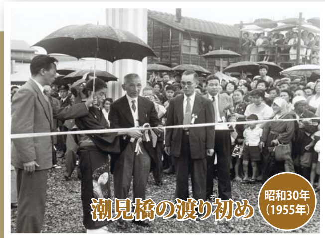
潮見橋の渡り初め 昭和30年(1955年)