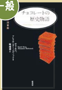
サラ・モス、アレクサンダー・ハ アニック/著 堤理華/訳 原書房/発行