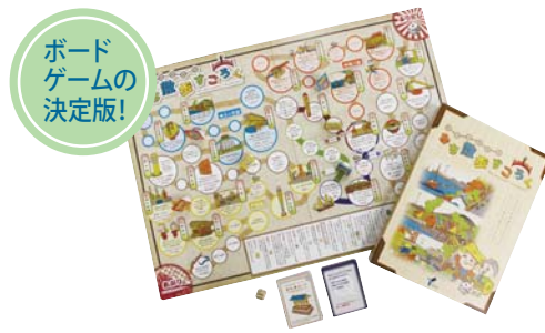
ボード ゲームの 決定版!

区役所では現在、横浜の旧東海道を楽しみながら学べる「横浜旧東海道 みち散歩すごろく」を無料で貸し出しています。