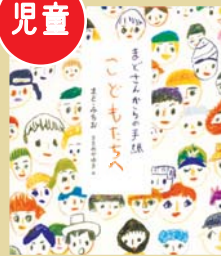
まど・みちお/著 講談社/発行