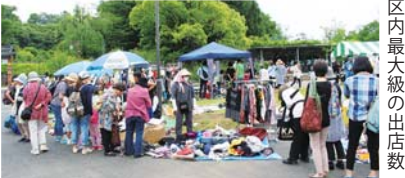
区内最大級の出店数

㊟5月20日(土)9時30分～16時※荒 天は21日に順延 ㊠県立三ツ池公園 (三ツ池公園1-1) ㊡区在住者※4月15日 (土)14時からの出店者説明会への出 席が必須。食料品類や営利販売は不 可 ㊢70組程度 ㊣1,500円(1区画 3m×1.5m。出店場所の指定不可) ㊤ 3月20日までに ㊦必要事項、販売物品を明 記して ㊧(往以外は無効) ※1世帯 1口まで。駐車場の用意はありません ㊨三ツ池公園フェスティバル実 行委員会事務局(〒230-0076馬場 4-39-1 寺尾地区センター内) ㊩090-5805-4153(渡辺) ㊪584-2583