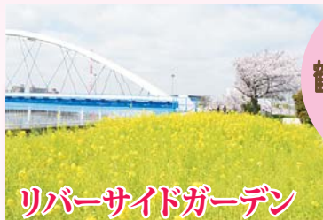
リバーサイドガーデン

菜の花の黄色と桜のピンク。春らしいコントラストが楽しめます。(鶴見川橋市場下町側・JR鶴見駅東口徒歩13分)