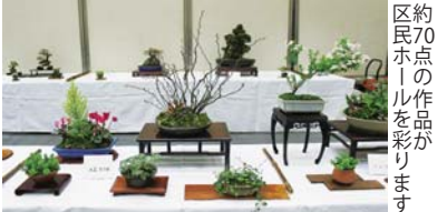
区約70点の作品が 民ホールの作品を 彩ります

ベランダや玄関先で楽しむための参考 に「小スペースのご提案」コーナーも ㊟3月27日(月)13時～17時・28日(火) 9時～17時・29日(水)9時～16時 ㊠ 区役所1階区民ホール ㊡ ㊢日本盆栽協会横浜東支部 ㊣573-6969(水谷)