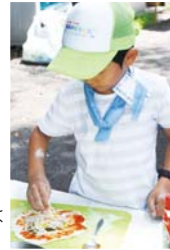
くいしんぼう大作戦ではピザ作りも

HP 三ツ沢野外活動センター イベント 検索 ①ヨガ&太極拳入門 ☎4月4日～7月18日の火曜日※5月2日、6月13日を除く(全14回)13時～14時☎16歳以上☎16人¥1回500円(一括6,500円)申3月15日8時45分から☎ ②鉄板祭り▶鉄板焼き、チーズケーキ等 ☎4月29日(土・祝)・30日(日)、5月7日(日)10時～14時☎家族かグループ☎各70人 ¥中学生以上2,200円、小学生1,800円、4歳～未就学児1,000円、3歳以下100円申3月28日までにHPか 必要事項 、年齢、性別、参加希望日を明記して☎ ③くいしんぼう大作戦▶おやつ作り、野外ゲーム、クラフト、流しそうめん等 ☎5月14日、6月25日、7月30日の日曜日(全3回)9時30分～15時30分☎小学1年～3年生☎48人¥9,000円申4月10日までにHPか 必要事項 、年齢、性別、学年を明記して☎