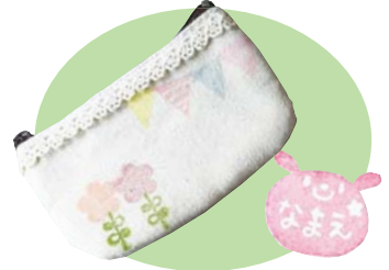
自分だけのかわいいはんこを作りましょう

消しゴムで「お名前はんこ」と「コインケース」を作ろう☎4月1日(土)13時30分～16時☎小学4年生以上☎10人¥お名前はんこ500円、はんこで作るコインケース800円申3月11日9時30分から窓か☎