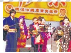
開場から開演までの間、ぶからず三線教室の皆さんによる演奏が披露されます