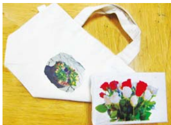
お気に入りの写真をキャンパスパネルなどに転写

②～⑥の申は3月11日9時30分から窓か☎または 必要事項 を明記して☎ ①子育て中ママ応援! 赤ちゃんポニー ▶親子のたまり場☎4月3日(月)10時～12時☎1歳以下の子と保護者☎ ②ウォーキング体操 ☎4月12日・19日・26日の水曜日(全3回)13時30分～15時☎18歳以上☎10人¥500円持タオル、飲み物 ③詩吟無料講座 ☎4月15日・22日の土曜日(全2回)10時～12時☎18歳以上☎10人持筆記用具、飲み物 ④新ママカフェ 親子でリミック ☎4月17日、5月15日、6月19日、7月24日、9月25日の月曜日(全5回)①10時～10時40分②11時～11時40分☎①8か月～1歳4か月児と保護者②1歳5か月～3歳児と保護者☎各20組¥2,000円持飲み物 ⑤はじめの一步! 英語ってたのしいよ ☎4月3日～30日3月19日の第1・3月曜日(全20回)16時～17時☎小学3年～4年生☎10人¥4月～9月3,500円、10月～30日3,500円(テキスト代別途1,000円程度)持筆記用具 ⑥たいせつな人に、いつもありがと! 転写パネルづくり ☎4月22日(土)10時30分～12時☎小学生☎15人¥200円持持ち帰り用袋