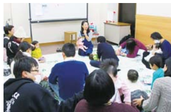
司書やボランティアが赤ちゃん向けのわらべ歌等を紹介します

①朗読ライブラリー▶短編小説の朗読会㊟3月23日(木)14時~15時(開場13時50分) ㊟ ②親子でたのしみおはなし会㊟3月28日(火)11時~11時30分 ㊟1歳6か月~3歳児と保護者 ㊟ ③赤ちゃんとのしむおはなし会㊟3月24日(金)10時30分~11時(開場10時15分) ㊟4か月~1歳6か月児と保護者 ㊟