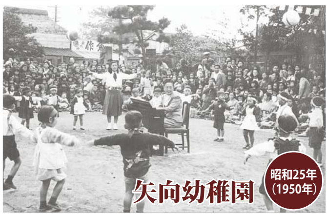
昭和25年(1950年) 矢向幼稚園

終戦後5年が経ち、市民の生活も徐々に落ち着きが見えてきた昭和25(1950)年、矢向幼稚園で行われた運動会の風景です。くす玉や万国旗の下で、足踏みオルガンの音色に合わせてお遊戯をする子どもたち。周りの民家にも、まだ茅ぶき屋根が見受けられました。ここにいる子どもたちも、現在70歳前後になっていることでしょう。