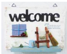
木製のボードにミニチュア小物を飾り付け