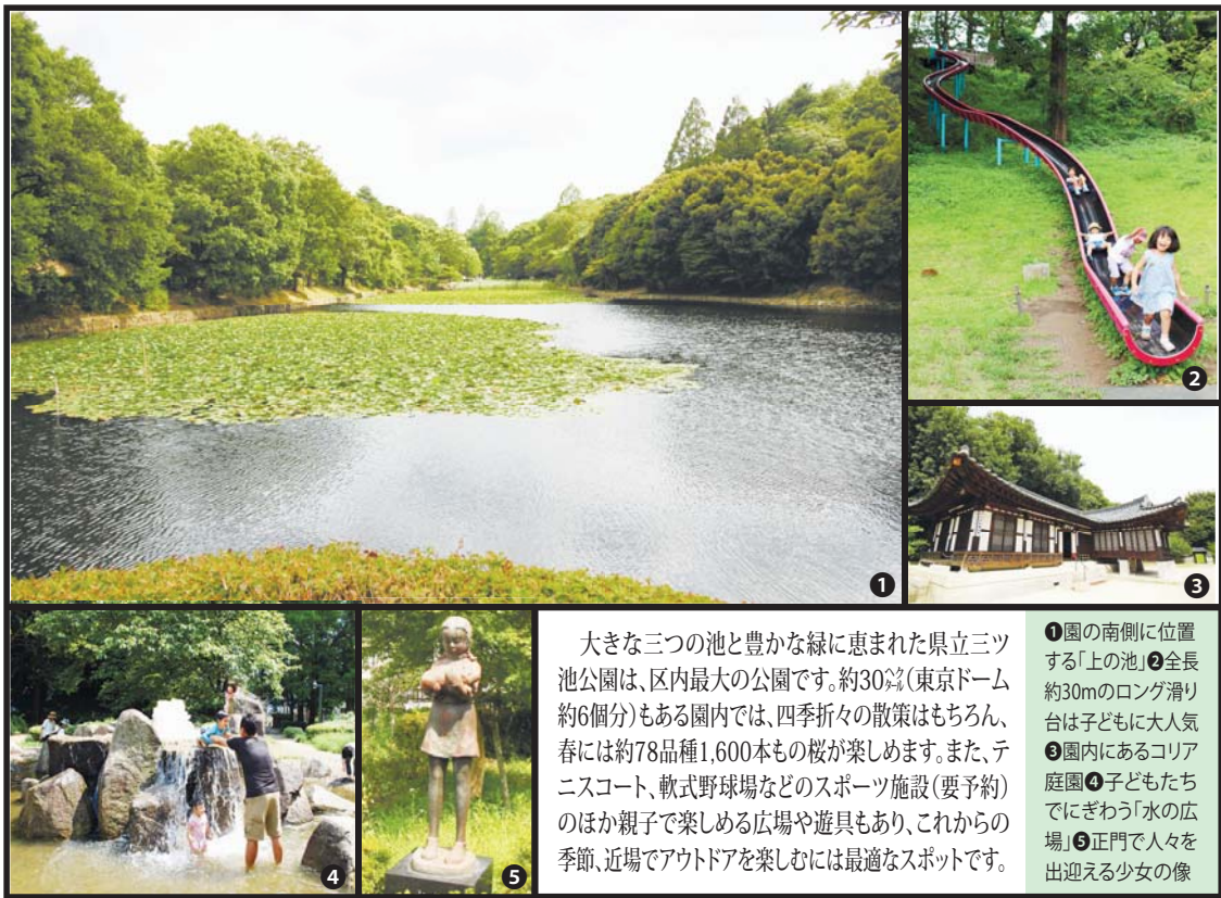
大きな三つの池と豊かな緑に恵まれた県立三ツ池公園は、区内最大の公園です。約30分(東京ドーム約6個分)もある園内では、四季折々の散策はもちろん、春には約78品種1,600本もの桜が楽しめます。また、テニスコート、軟式野球場などのスポーツ施設(要予約)のほか親子で楽しめる広場や遊具もあり、これからの季節、近場でアウトドアを楽しむには最適なスポットです。