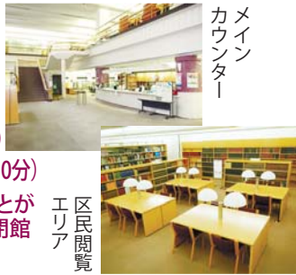
区民 エリア 閲覧