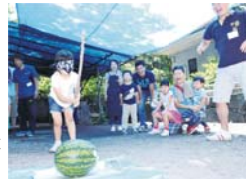
家族クラブではスイカ割りも!