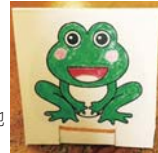
カエルがどんなふうに着地するかで運勢を占います