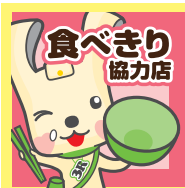
このマークが目印!

食べきり協力店とは、「小皿メニュー」や「ご飯の量の調整」、「持ち帰り可」など、食べ残しを減らす工夫をしているエコなお店のことです。現在、市内の食べきり協力店は約690店。店名や所在地は、HPから。 横浜市 食べきり協力店 検索