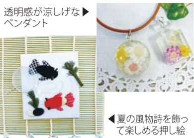
透明感が涼しげなペンダント