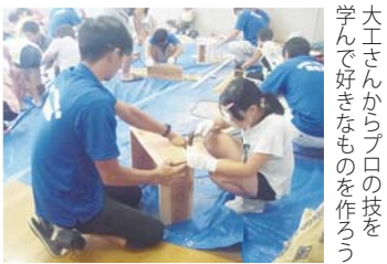
大工さんからプロの技を学んで好きなものを作ろう