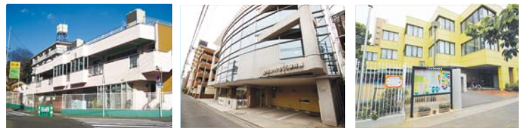
鶴見乳幼児福祉センター 保育園(鶴見1-3-16) ☎581-5653