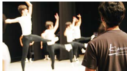
躍動感あふれる演技をお楽しみください