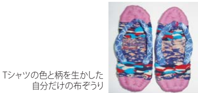
Tシャツの色と柄を生かした自分だけの布ぞうり