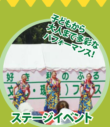
ステージイベント