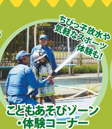
子どもあそびゾーン・体験コーナー