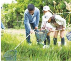
水辺の生きもの博士になろう

ヤゴをつかまえて調べてみよう! ㊟5月22日(日)10時～12時15分 ㊠JFEトンボみち(末広町1-1-5)※雨天時は室内で実施 ㊡小学生以上 ㊢30人 ㊣100円 ㊤5月16日までに必要事項と参加者全員の氏名、学年を明記して ㊦(motomura-tomoko@jfe-eng.co.jp) ㊧JFEエンジニアリング(株)業務支援センター ㊨505-7447