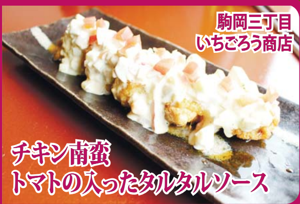
チキン南蛮 トマトの入ったタルタルソース

甘酢を絡めた鳥のから揚げに生のトマトが入ったタルタルソースをかけ、その上に刻みトマトをまぶした夏にピッタリの一品です。チキン南蛮は店主の故郷、宮崎の味。ランチでは、定食(950円税込)でも食べられます。 ◆単品650円(税抜) ◆駒岡三丁目いちごろう商店(駒岡3-19-24) 問 区役所地域振興係 ☎510-1688