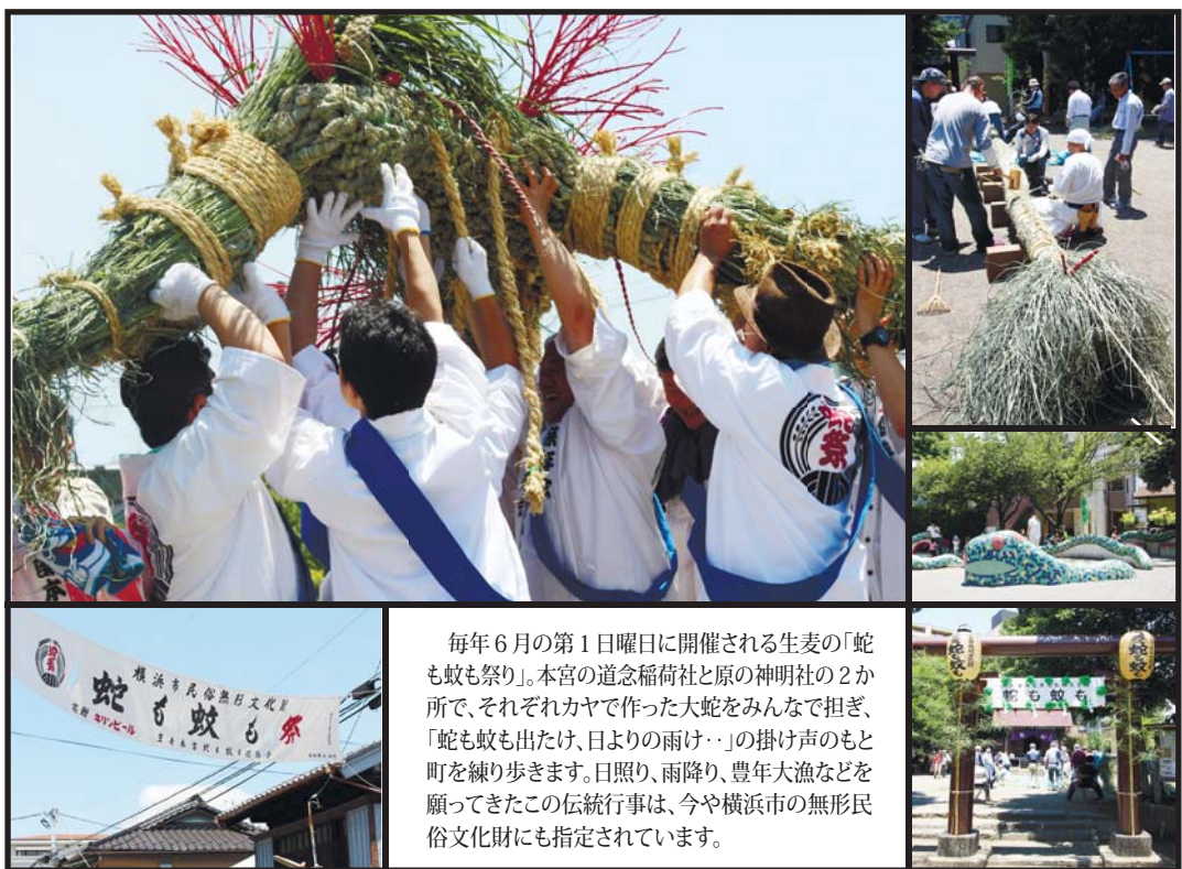
毎年6月の第1日曜日に開催される生麦の「蛇も蚊も祭り」。本宮の道念稲荷社と原の神明社の2か所、それぞれカヤで作った大蛇をみんなで担ぎ、「蛇も蚊も出たけ、日よりの雨け…」の掛け声のもと町を練り歩きます。日照り、雨降り、豊年大漁などを願ってきたこの伝統行事は、今や横浜市の無形民俗文化財にも指定されています。