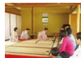
春祭り▶軽食の模擬店やお茶席など 4月23日(土)10時～15時 画