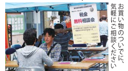
お買い物のついでに、気軽に相談ください