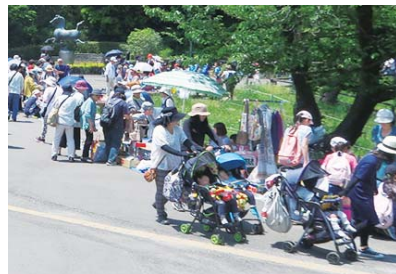
昨年は延べ5万人が来場

5月12日(土)9時30分～16時※雨天時は13日に順延 県立三ツ池公園(三ツ池公園1-1) 区在住者※4月14日(土)14時からの出店者説明会への出席が必須。食料品類や営利販売は不可 70組程度 ¥1,500円(1区画3m×1.5m。駐車場の用意はありません) 3月20日(当日消印有効)までに必要事項、販売物品を明記して(往以外は無効) ※1世帯1口まで。出店場所の指定不可 三ツ池公園フェスティバル実行委員会事務局(〒230-0076馬場4-39-1 寺尾地区センター内) 090-6504-8114(杉浦) 584-2583