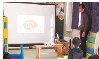
大きな画面で絵本を楽しめる人気のイベント