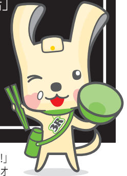
「ヨコハマ3 R 夢」 マスコット イーオ

せっかく出されたおいしい料理を残してしまうのは「もったいない」ことです。市では、この考えにご賛同いただける飲食店などに協力いただき、効果的に食べ残しを減らす取組「食べきり協力店」事業を進めています。現在、区内で23店舗、市内では791店舗が加入しています。「食べきり協力店」に加入することで、市のホームページなどに店名が掲載されます。