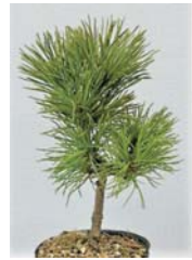
高さ20cm程度(鉢含む)のミニ盆栽です

①季節先取りの生菓子づくり▶お土産10個つき㊟4月17日(火)14時~16時 ㊟成人先12人 ¥1,500円 ㊟3月20日10時から㊟(㊟は14時から) ②ミニ盆栽を育ててみよう!&秋のお手入れ術▶五葉松の盆栽づくり㊟4月8日・10月28日の日曜日(全2回)10時~12時 ㊟成人先10人 ¥1,800円 ㊟3月12日10時から㊟(㊟は14時から)