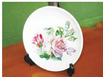
紙に描かれた絵をうつして、オリジナルのお皿を作ろう