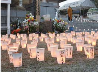
復興への祈りを万灯に 込めて

祈念コンサート(福島県立安積黎明高等学校合唱団、横浜市立上寺尾小学校特別合唱部)、万灯供養など 3月10日(土)14時～19時 大本山 總持寺(鶴見2-1-1) 1,500人 ※万灯供養献灯受付あり 鶴見区文化協会 582-0881