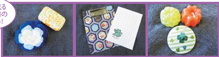
エコたわし&せっけんのデコパーズ 紙ばさみ&ひとふみ箋 キャンドル&マグネット ※景品には限りがございます。ご了承ください

3/10 駒岡 地域ケアプラザ 出店やイベントなど、多数をご用意しています 🕒 3月10日(土)10時～15時 📍 駒岡4-28-5 申 当日直接会場へ ☎ 570-6601 fax 570-6602