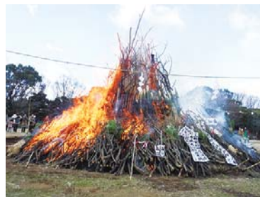
お正月飾りを燃やします