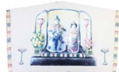
粘土を使って絵を立体的に浮かせます

デコパージュのお雛様プレート▶しっとり落ち着いた絵柄のおひなさまのプレート飾り ㊟2月10日(土)13時30分～16時 ㊟成人 ㊟10人 ㊟1,200円 ㊟1月12日9時30分から窓か㊟