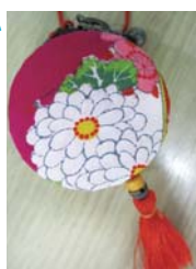
500円玉が3枚入るストラップ

①布あそび〜かわいいマカロンのコインケース〜 10月16日(月)13時～16時 先成人 先10人 ¥400円 申9月11日10時から窓(☎は14時から)