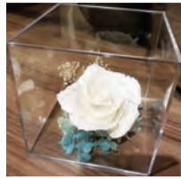
花びらには好きな色をつけられます

6月7日(金)10時～12時 先10人 ¥1,000円 持 持ち帰り用袋、手拭き 申 6月12日10時から窓(☎は14時から)