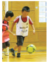
サッカー尽くしの1日で夏休みの思い出を作ろう!