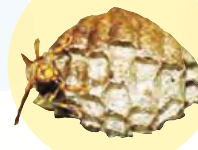
アシナガバチの巣