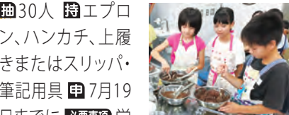
チョコレートの試食もあるよ!

森永製菓の研究者によるお話と高校生との実験で、チョコレートのおいしさの秘密を探る ㊟8月2日(木)14時～16時30分 ㊢横浜サイエンスフロンティア高校(小野町6) ㊣区内在住・在学の小学4～6年生 ㊤30人 ㊦エプロン、ハンカチ、上履きまたはスリッパ・筆記用具 ㊦7月19日までに ㊧必要事項 学校名、学年、食物アレルギーの有無を記入して HP か 往