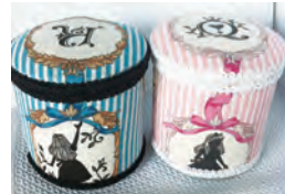
綿棒ケースとティッシュボックスケースに布地を貼ってカルトナーズ風にデコレート

①ファブリックデコの綿棒ケース&ティッシュボックスケース ㊟7月21日(土)13時30分～16時30分 ㊢成人 ㊤10人 ㊦900円 ㊩6月20日9時30分から窓