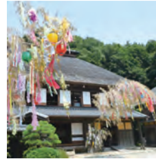
敷地内に生えている大きな竹を使った七夕飾りは圧巻!

7月7日(土)10時～11時30分 先10組20人(小学生以下は保護者同伴) ¥1組2,000円(3歳未満無料) 申 6月11日9時30分から ☎ または 必要事項を明記して fax か ☎