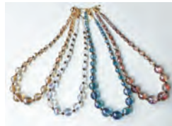
チェコガラスのビーズを使います