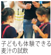
子どもも体験できる麦汁の試飲