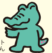
鶴見区のマスコット ワックン