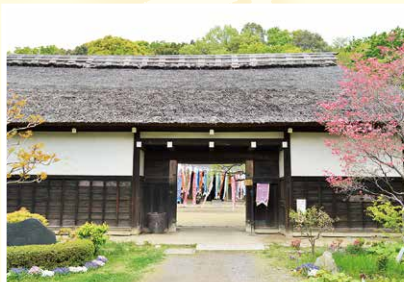
丘のまち「横溝屋敷」