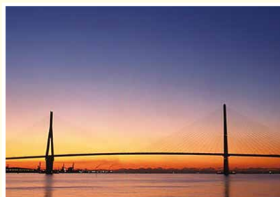
海のまち「鶴見つばさ橋」