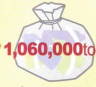
Sa taon 2005