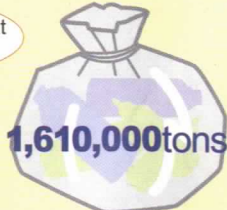
Sa taon 2002