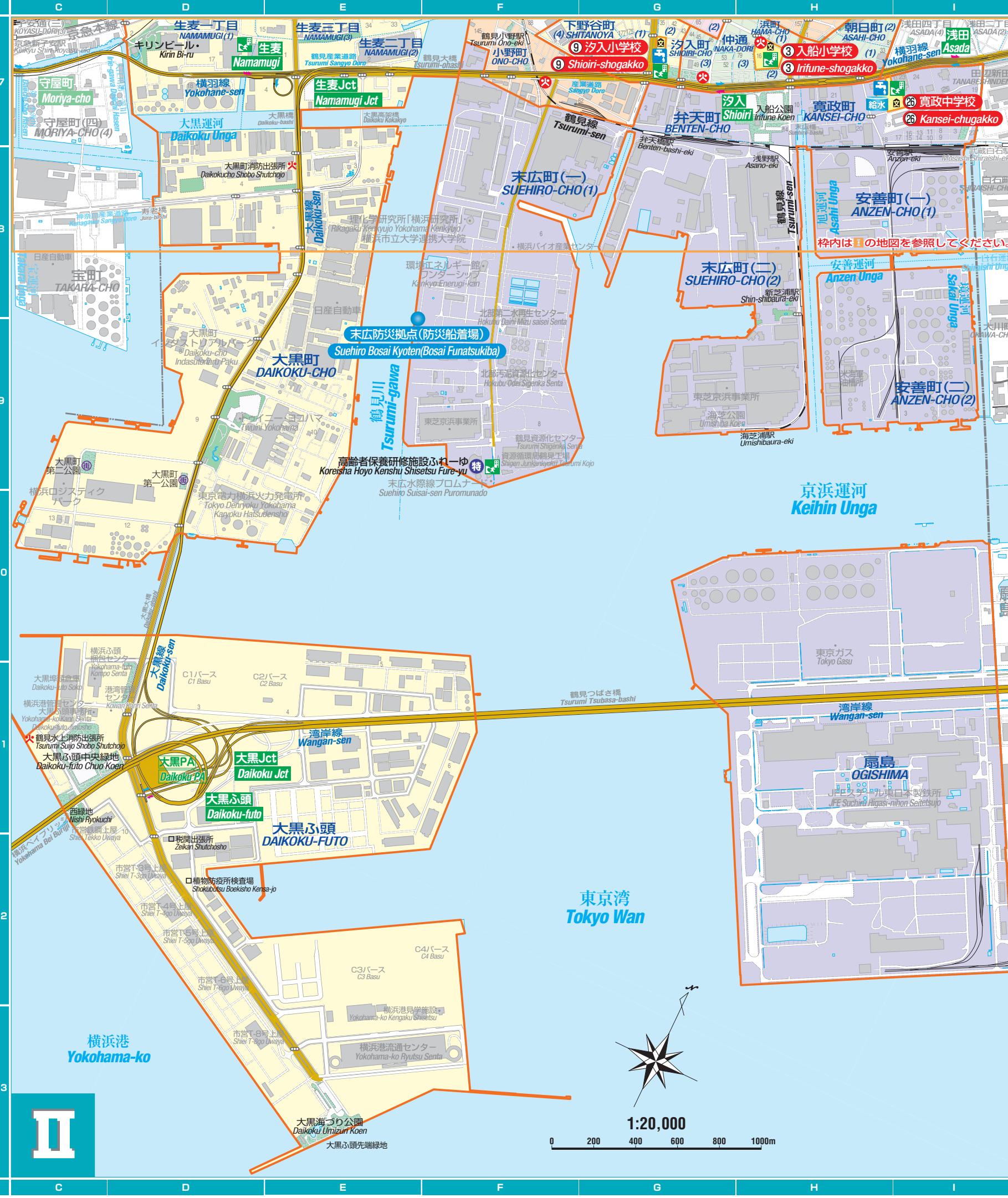
この地図は平成24年12月31日現在の情報を元に制作されています