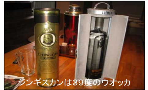
ジンギスカンは39度のウオッカ

えいぎょうじかん じ じ でんわ 営業時間:17時から24時 電話:045-521-8336 じゅう しょ つる みくつる みちゆうおう 住所:鶴見区鶴見中央4-24-12 けいきゅうつる みえき まえ かい 京急鶴見駅の前 シオダビル3階