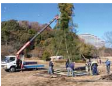
毎年北山田町会会のどんど焼きの檜づくりにも協力しています