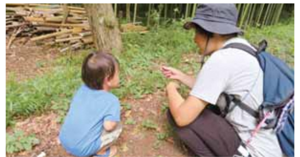
子育て支援「さんぼのわ」は環境省の環境教育体験活動優良事例に選ばれました