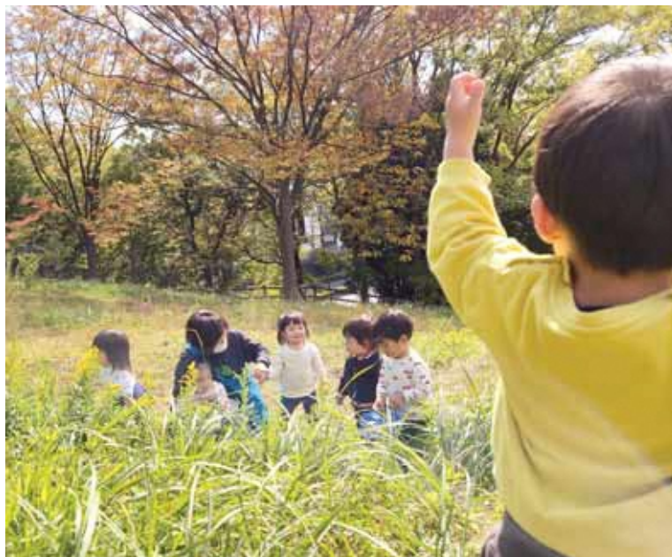
保育中の外遊びでは、子どもたちが自然の中でのびのびと楽しんでいます