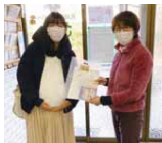
「コウトリプロジェクト」は妊娠期からの切れ目ない支援で、立ち寄った妊婦さんにプレゼントをお渡ししています