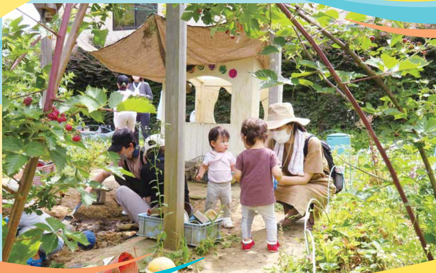
センター北キッズファーム(地域の菜園)で土に触れたり、野菜の収穫を楽しむ親子

都筑区では、様々なNPO法人が専門分野やテーマに いかり 錨「ANCHOR」を下ろし、地域課題に取り組んでいます。 各団体の活動の中での工夫やアイデア、自治会町内会等と 協力している事例も含め、その魅力的な取組をご紹介します。