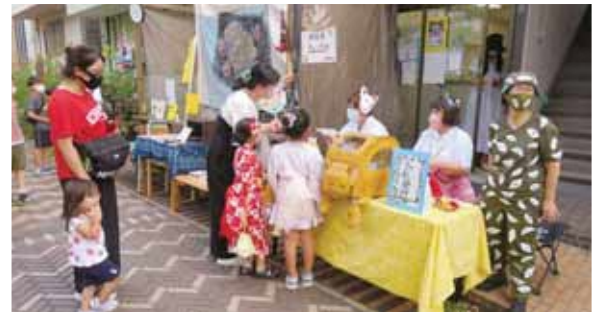
商店会に加盟してイベント開催に協力し、地域でのネットワークを広げています