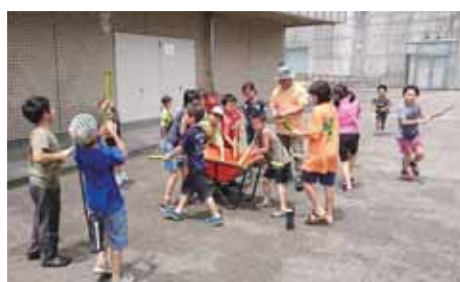
夏の人気講座で小学生が竹を使い水鉄砲を手作ります