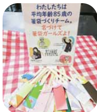
お手紙弁当の利用者さんも箸袋作りに協力