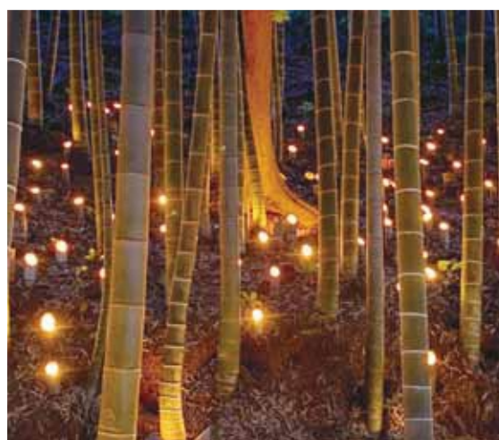
灯籠用に切り出した竹に水を入れ、浮かべた蝋燭に火をつけて幻想的な空間を創造します