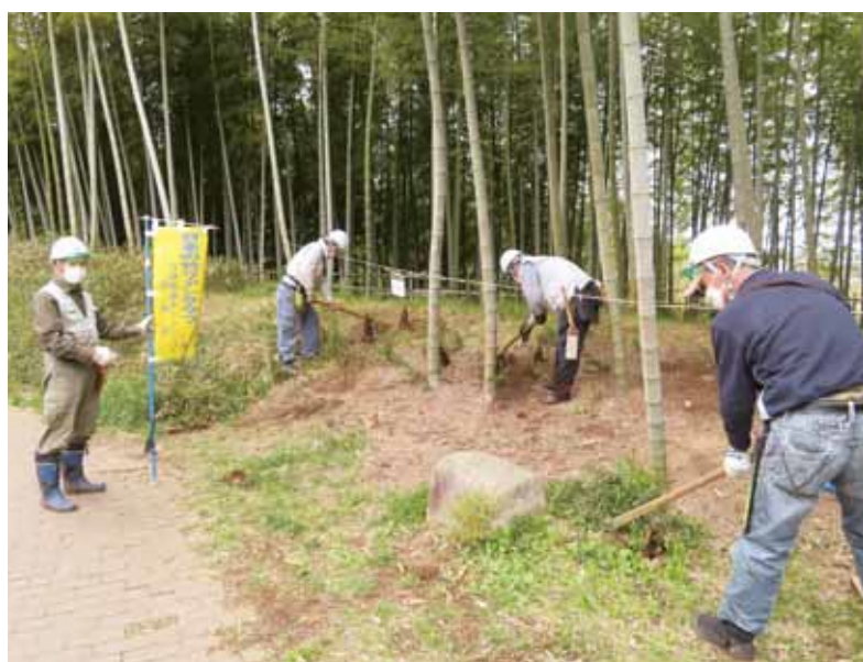
「竹取協力隊」が竹林の里親となり、地主さんに代わり竹林を再生しています