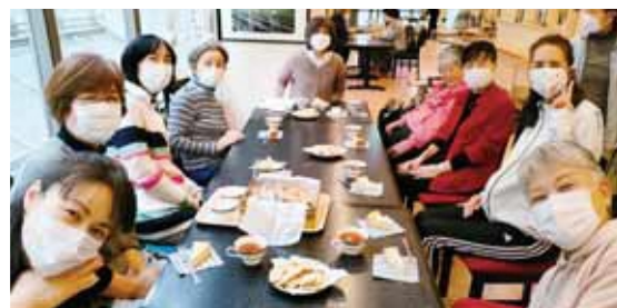
お手紙弁当チームと利用者さんがお手紙をきっかけにリアルに交流