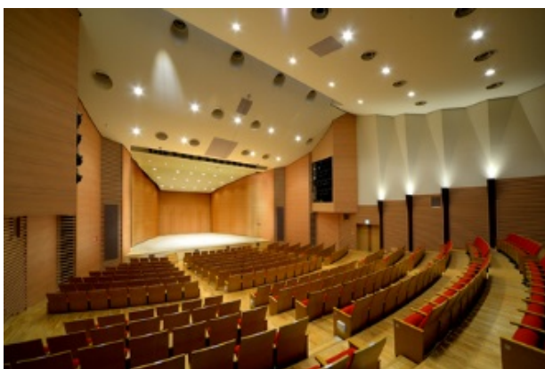
写真：緑区民文化センター みどりアートパーク ホール

地域に根差した個性ある文化の創造に寄与するために横浜市区民文化センター条例に基づき設置される「地域文化芸術活動の拠点」です。