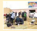
▲避難所開設・運営訓練で、実際の避難生活のスペースを体感しています。