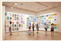
2012年横浜市市民ギャラリー