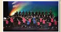
磯子区民文化センター 杉田劇場「杉劇リコーダーずの定期演奏会×杉劇☆歌劇団」