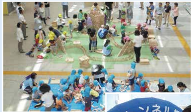
▲積み木を使った遊びを通して、保育施設や幼稚園などにおける地域の子育て支援を進めています。

地域・学校・団体・区役所が連携し、子育て支援のネットワーク化や地域活動の活性化を図り、子育て世代と地域の交流を進めます。妊娠前から小・中学生までの切れ目のない子育て支援を地域ぐるみで進めていきます。