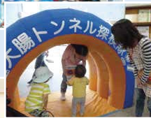
▲大腸がんの正しい知識を啓発し、がん検診受診の大切さを伝えています。