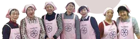
(中川地区ヘルスメイト)