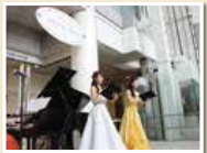
横浜市ギャラリーあざみ野「ロビーコンサート」(左)「あざみ野マルシェ」(右)