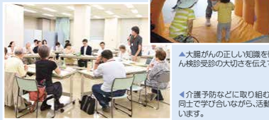
▲介護予防などに取り組むリーダー同士で学び合いながら、活動を進めています。

高齢者が住み慣れた地域で、その心身の状態に応じて自立意欲を保ち、互いに支え合い、安心して暮らしていることができるまちを目指します。そのために介護予防・認知症予防などに取り組むリーダーを育成し、地域で身近な活動の場が増えるよう支援します。