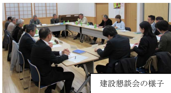
建設懇談会の様子

第2回目の懇談会（平成29年11月27日開催）では、第1回懇談会で頂いた意見を基に作成した「（仮称）都田地区センター・地域ケアプラザ」諸室配置イメージについて、引き続き、この施設に必要な機能・仕様等について、出席者の皆様と意見交換を行いました。