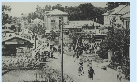
昭和初期の川和町 中央の建物が警察署、右奥が郡役所

明治12年(1879)川井(旭区)から都筑郡役所が川和に移転してから、周辺地域の政治・経済の中心地として栄えた。昭和14年(1939)に横浜市港北区に編入され、港北区川和出張所が設置された。その後、昭和39年(1964)に出張所から支所となり、昭和44年(1969)に港北区から分区して緑区が誕生し、これまでの支所に緑区役所が置かれた。しかし、昭和47年(1972)に緑区庁舎が中山に移転すると、これまでの地域の中心的な役割は薄れ、続いて緑警察署、郵便局、土木事務所も中山に移転するに従って、かつての行政の中心地としての役割も薄れていった。