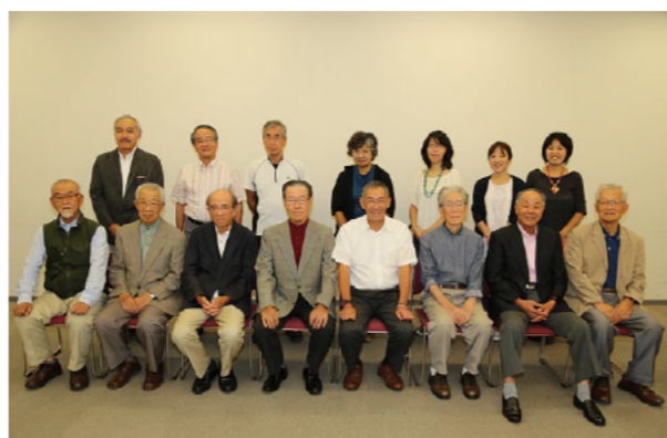
都筑区水と緑の散策マップ作成検討会 メンバー一同

都筑区 水と緑の散策マップ 平成26年11月発行 横浜市都筑区役所 区政推進課 令和2年12月増刷 〒224-0032 横浜市都筑区茅ヶ崎中央32-1 TEL 045(948)2225 FAX 045(948)2399 E-mail: tz-plan@city.yokohama.jp URL: http://www.city.yokohama.lg.jp/tsuzuki 編集/「都筑区 水と緑の散策マップ作成検討会」 印刷/(株)昭文社 無断転載、複製を禁止します。 200円(税込)