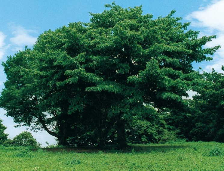
月出松公園のミズキとイヌザクラ