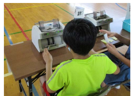
実際の計数機を使った開票作業