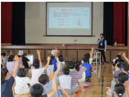
選挙のしくみを学びます