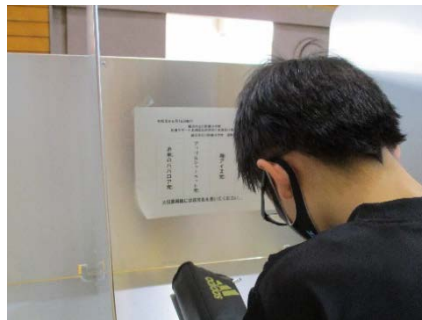
どのデザートにしようか？